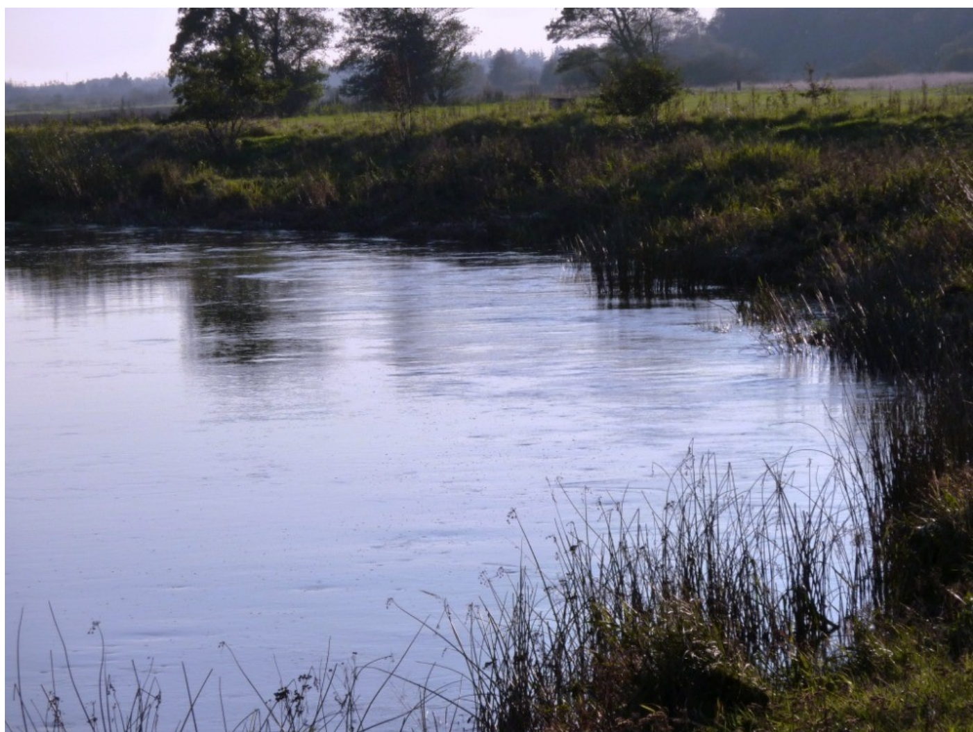
Motiv fra Borris hede