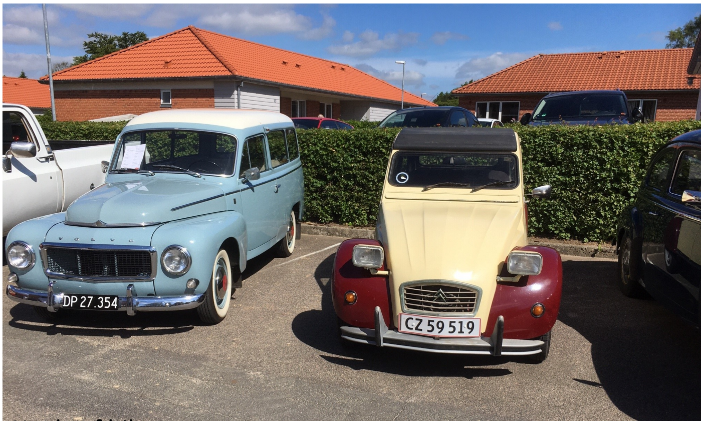
Nogle af bilerne

Der var stor aktivitet i det dejlige vejer