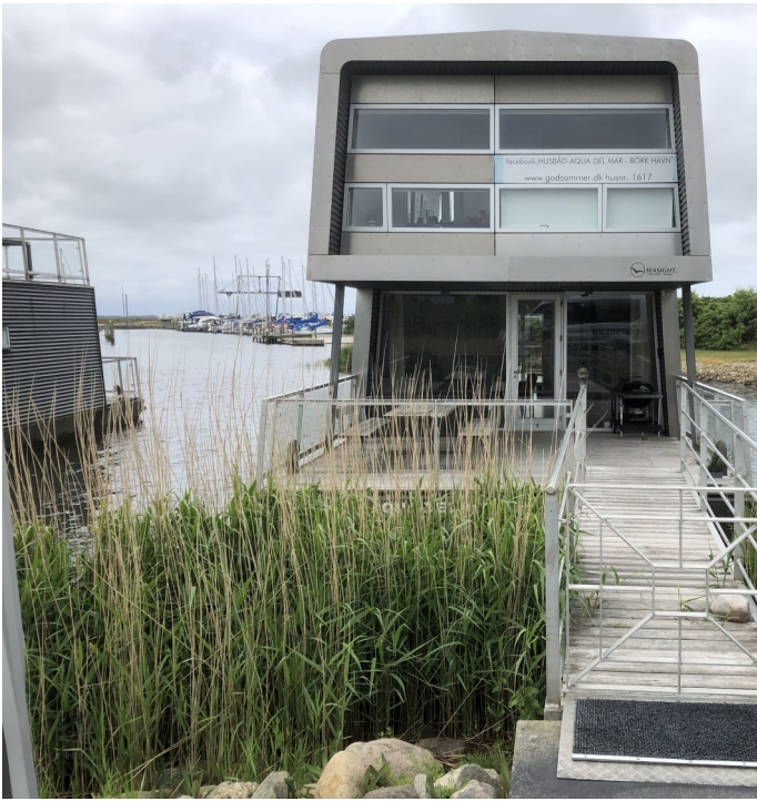
Noget af det vi så ved Havnen i Bork