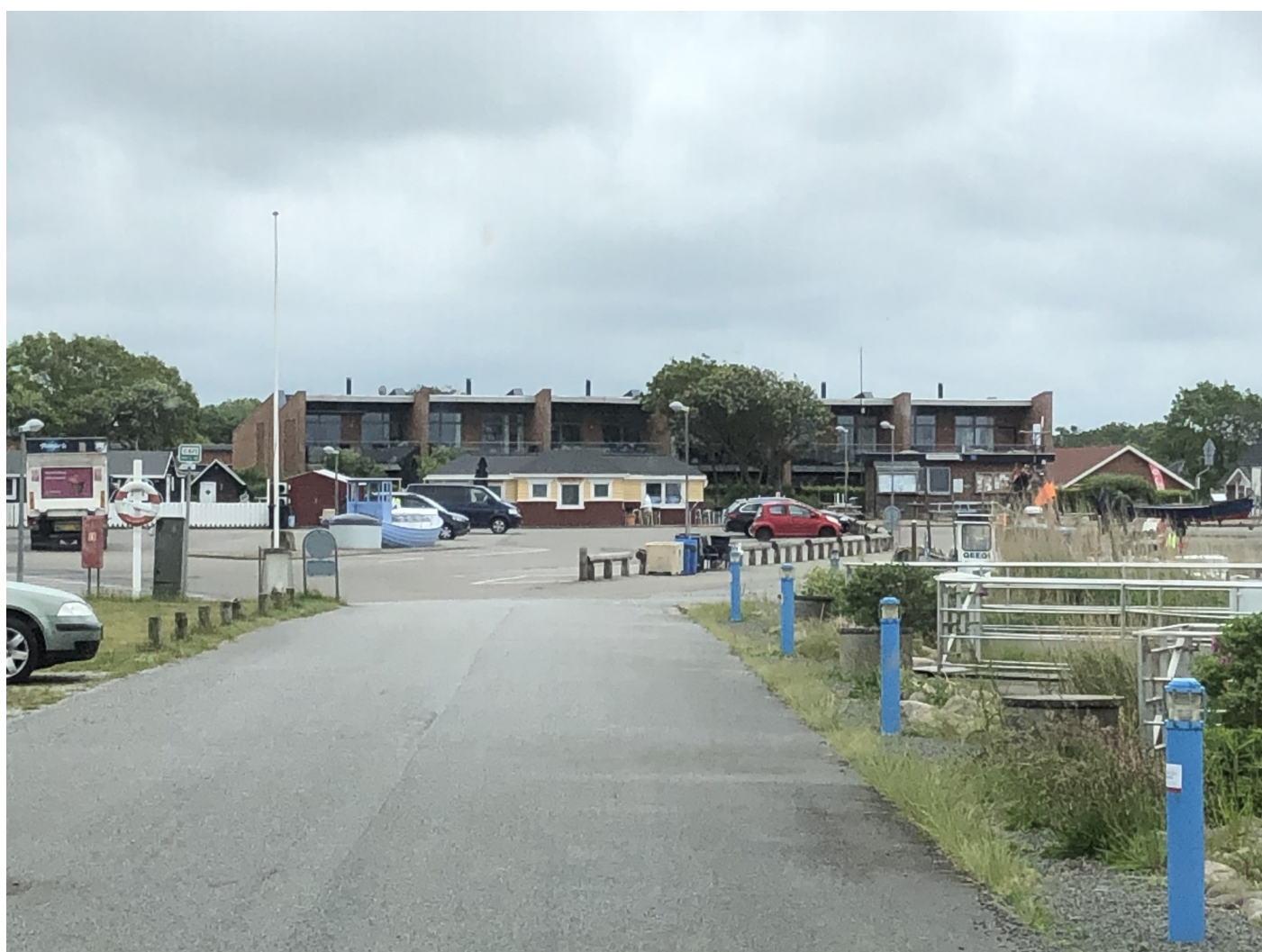
Motiv fra Bork Havn