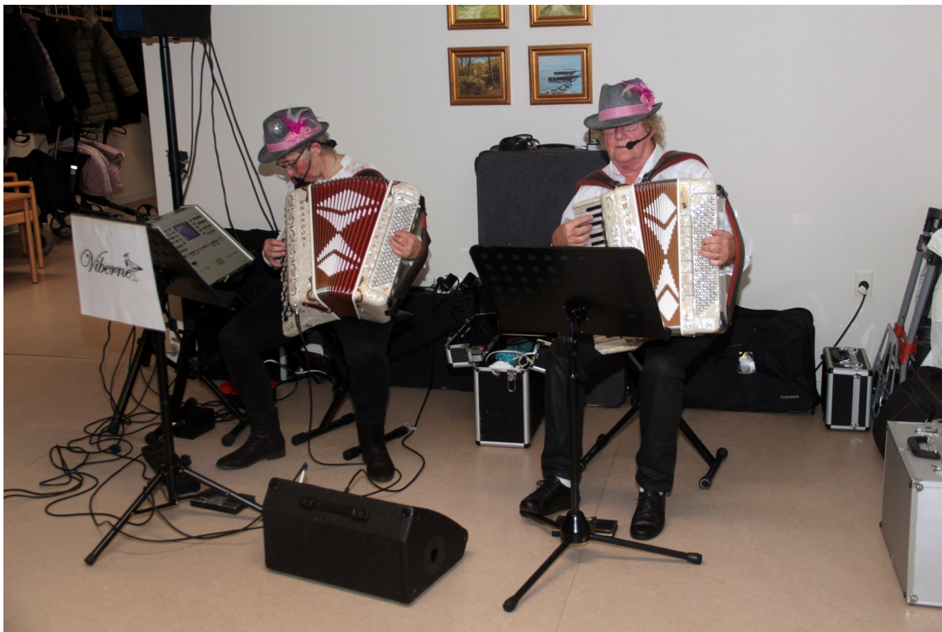
Der var god underholdning ved Viborne