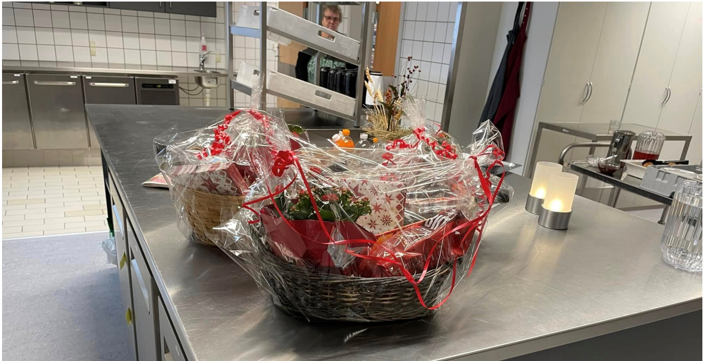
Der var 3 flotte gevinster på kaffebilletterne