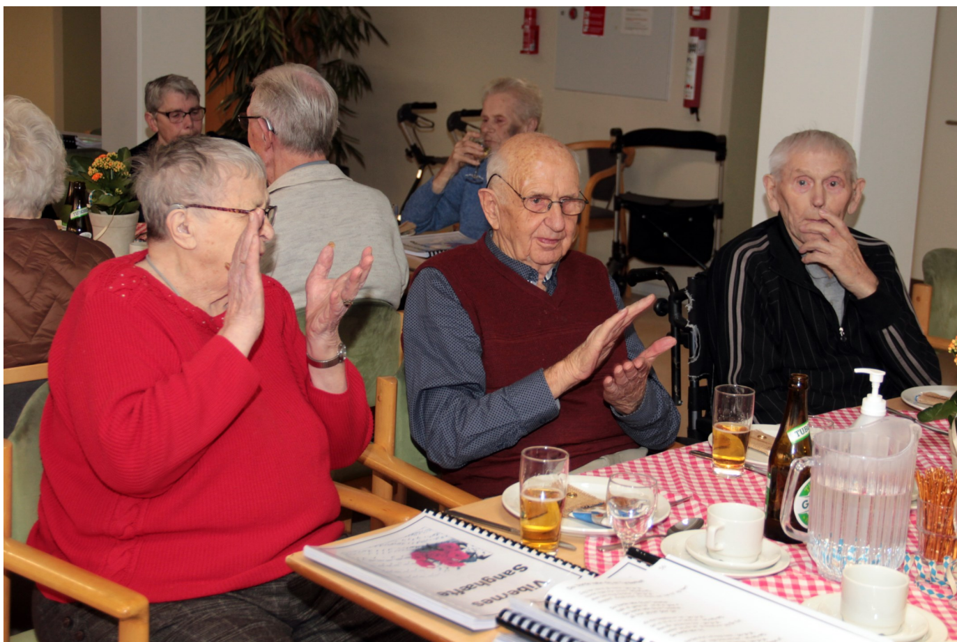
Forsamlingen nød det og hyggede sig