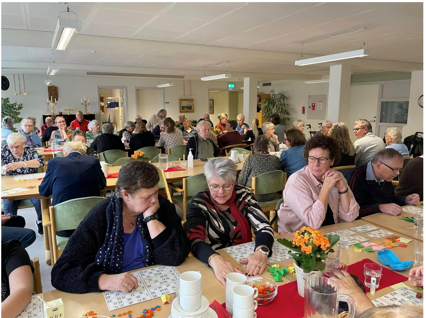
Der var mange mennesker til julebanko